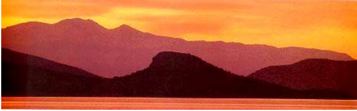
Bergkulissen bei Epidaurus