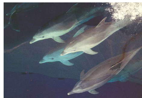
Freunde der Segler