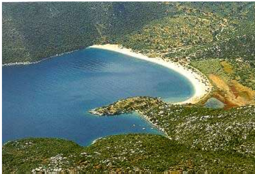
Bucht bei Kyparissi